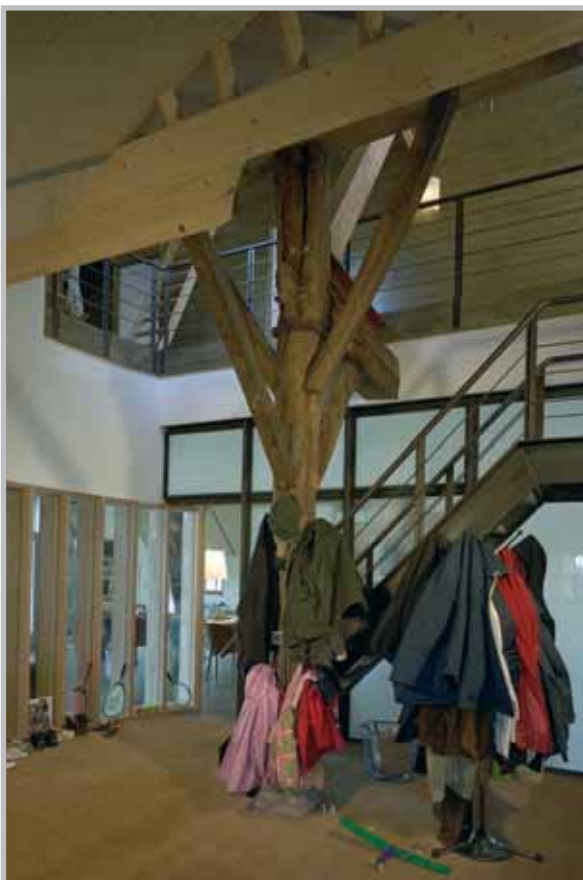
In één oogopslag zijn de gebinten met de hierop rustende overloop te zien.