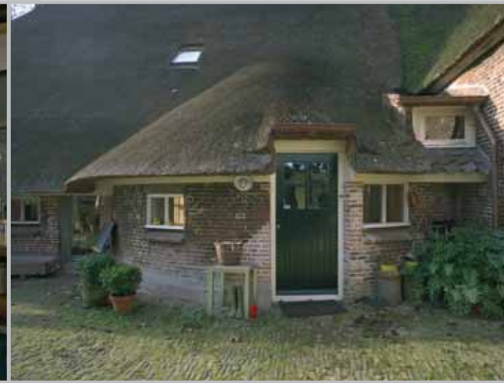
De ronding van de entree rust op de fundering van het oude karnhuis.