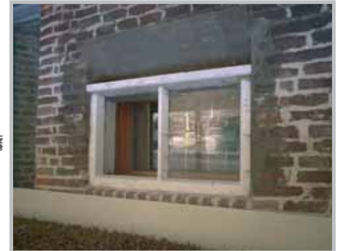
Prefab betonnen vensters met de derde en laatste glaslaag.