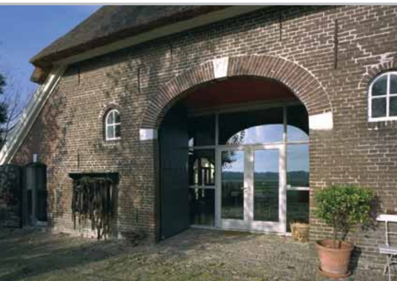
De Borchte ligt van de weg afgekeerd. De verplaatsing van het woongedeelte naar de deel keert deze situatie om.