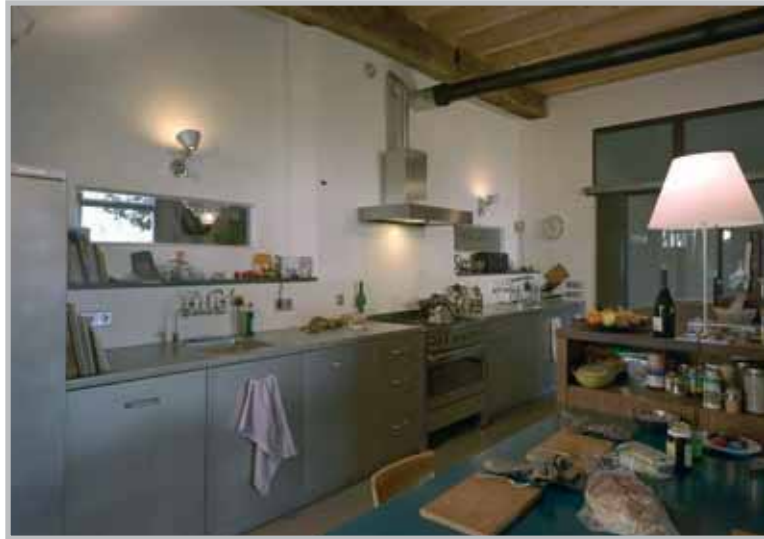
Het stalen aanrecht is naar eigen ontwerp.

De vloeren van gang en slaapkamers zijn blauwgrijs gebeitst en passen bij de leemkleurige, isolerende mortelvloer beneden. De vloerwaaltjes* verkasten van de deel naar het erf. Van gesloopte dakschoren werden een hek en schuren gemaakt. Zelfs de 4 m lange eettafel is getimmerd van oude balken; de poten zijn van de essenstaken waar tot voor kort de koeien nog tussen stonden. Want architect en eigenaar houden koste wat kost vast aan de spaarzame norm van de boeren, die vroeger op De Borchte woonden. ◀